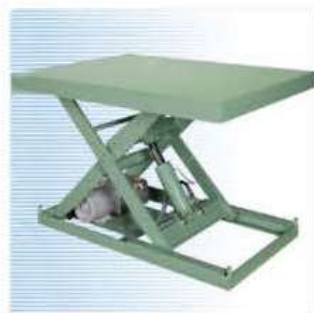
●リフター／(株) マキテック