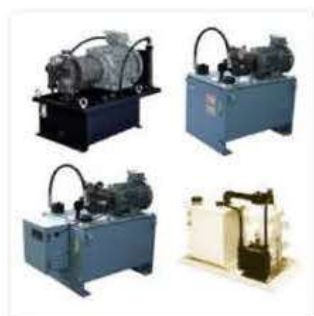
●標準油圧ユニット／油研工業 (株)