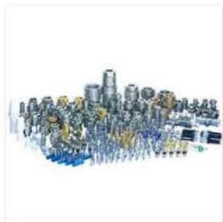
●カプラ／日東工器 (株)