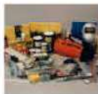
補修専用高級特殊 溶接棒