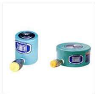
●油圧ジャッキ／(株) 大阪ジャッキ製作所