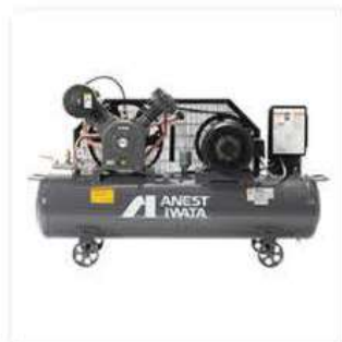
●レシプロコンプレッサ／アネスト岩田 (株)