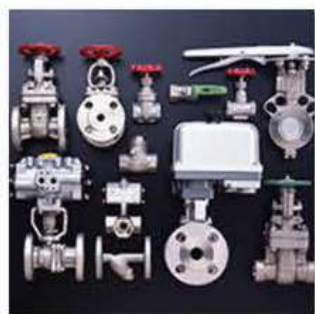
●SUSバルブ集合／(株) キッツ