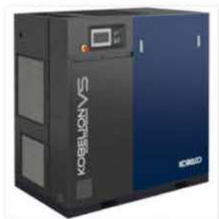
●スクリーコンプレッサ／コベルコ・コンプレッサ (株)