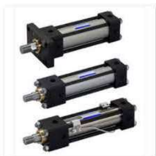
●油圧シリンダー／油研工業 (株)