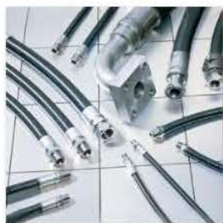
●高圧ゴムホース／(株) プリチストン