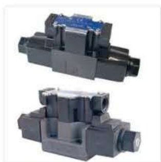
●DSG-01シリーズ電磁切換弁／油研工業 (株)