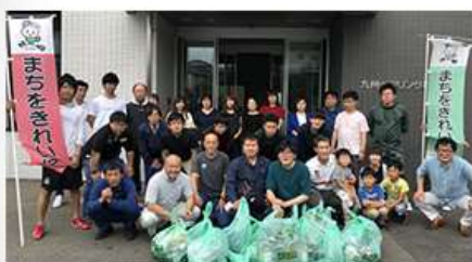
北九州市まち美化清掃活動