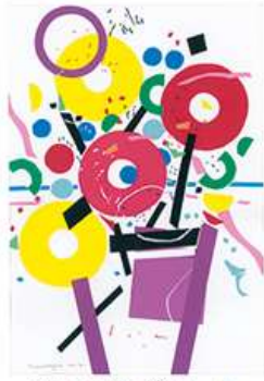
ベアリングアート